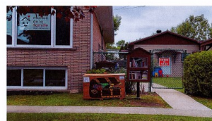
Trésor oublié Trésor oublié

de la Maison de la famille Memphrémagog.